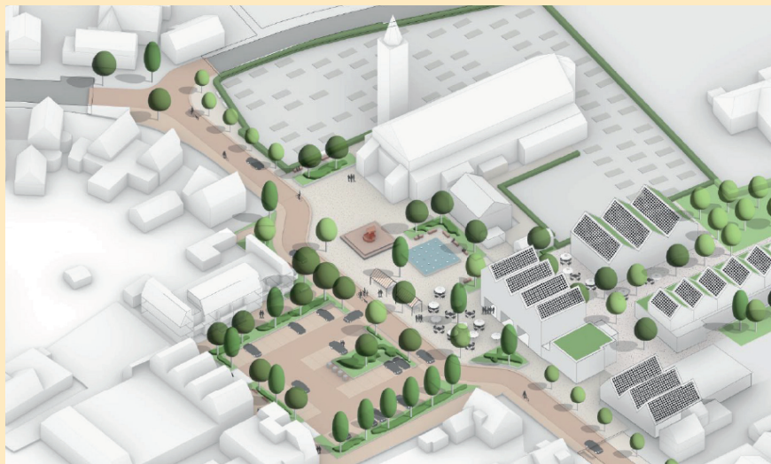
Uit burgerparticipatie ontstane wensbeeld voor de revitalisering van ons dorps hart

heeft geld beschikbaar gesteld om het hart van Driel aan te pakken. De werkgroep wil sociaal-maatschappelijke ambities die spelen binnen het dorp, er buiten of bij de gemeente combineren tot 1 integraal beleid. Bijvoorbeeld: Een ontmoetingsplek/huiskamer, een bibliotheekservicepunt en andere welkome initiatieven. Andere ambities gaan over zorg- en commerciële functies, zoals vergroten zorgaanbod, horeca, recreatie, werkateliers, kleinschalige winkelvoorziening, wonen in het centrum, maar ook de invulling van de openbare ruimte.